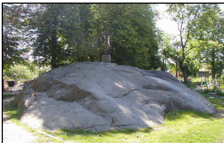
Zdjęcie 1. Głaz narzutowy „Trygław” w Tychowie.