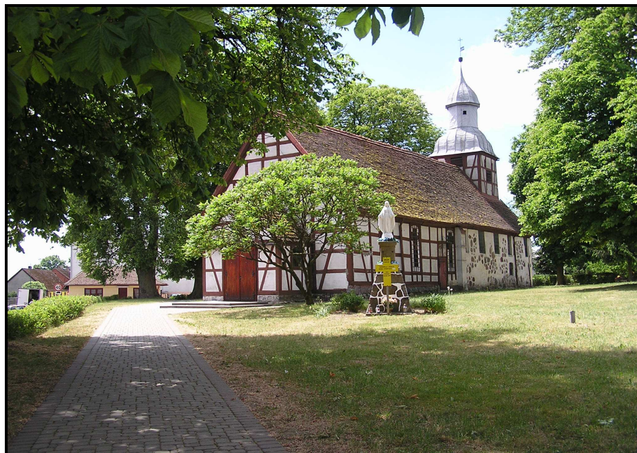
Zdjęcie 2. Kościół parafialny p.w. Matki Boskiej Wspomożenia Wiernych w Tychowie.