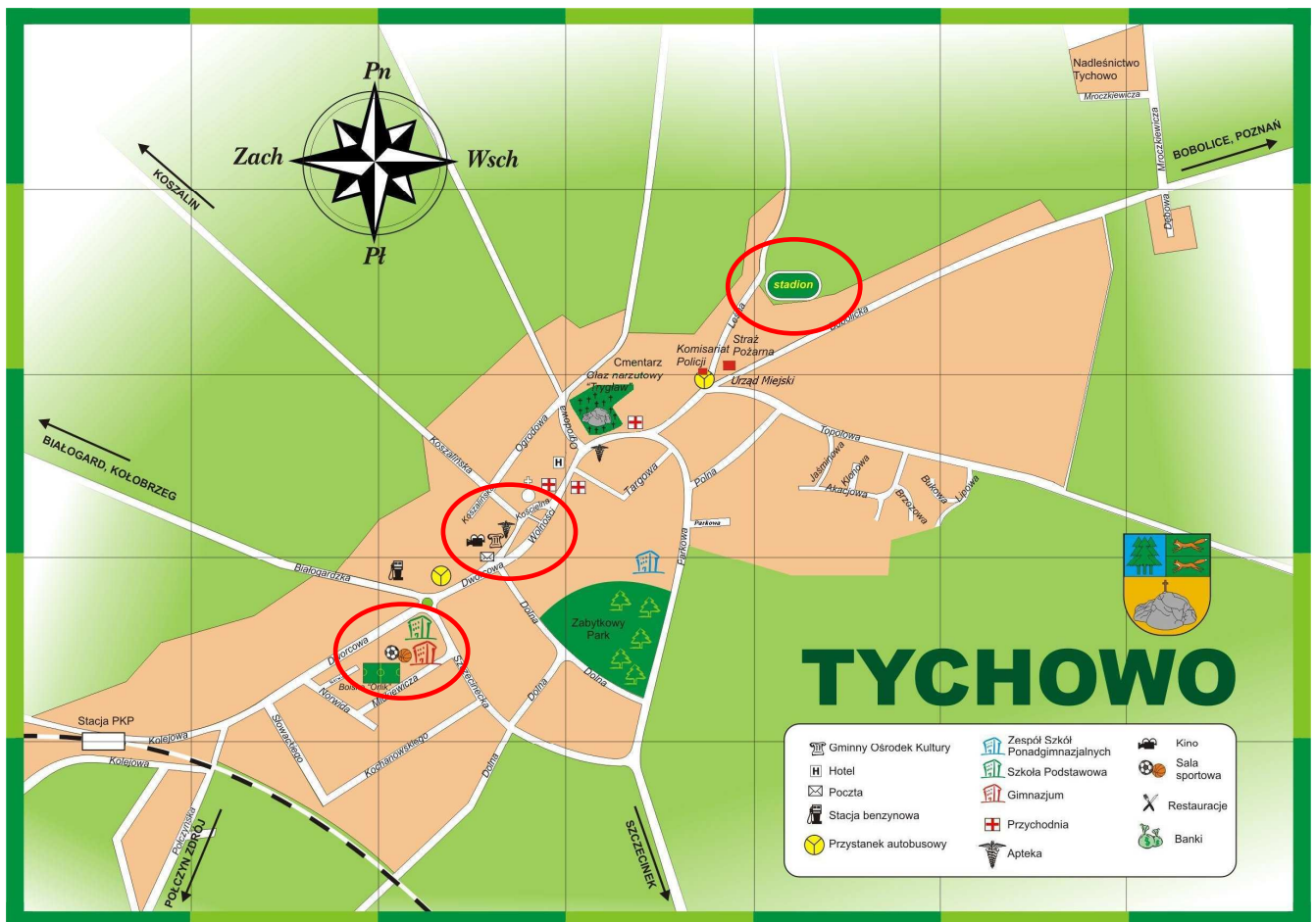
Mapa nr 1. Mapa obrazująca obszary o szczególnym znaczeniu dla zaspokojenia potrzeb mieszkańców